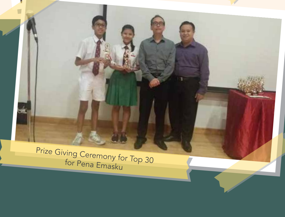
Prize Giving Ceremony for Top 30 for Pena Emasku

Setiap tahun, dua orang pelajar dilantik sebagai Rakan Bahasa oleh Majlis Bahasa Melayu Singapura. Kemahiran pelajar diasah melalui pelbagai program latihan supaya mereka dapat menimba pengetahuan tentang Budaya Melayu dan berkomunikasi dalam Bahasa Melayu dengan berkeyakinan. Mereka juga terlibat secara aktif dalam majlis pelancaran Bulan Bahasa di mana mereka diberi peluang yang autentik untuk berinteraksi dan berkongsi dengan orang awam.