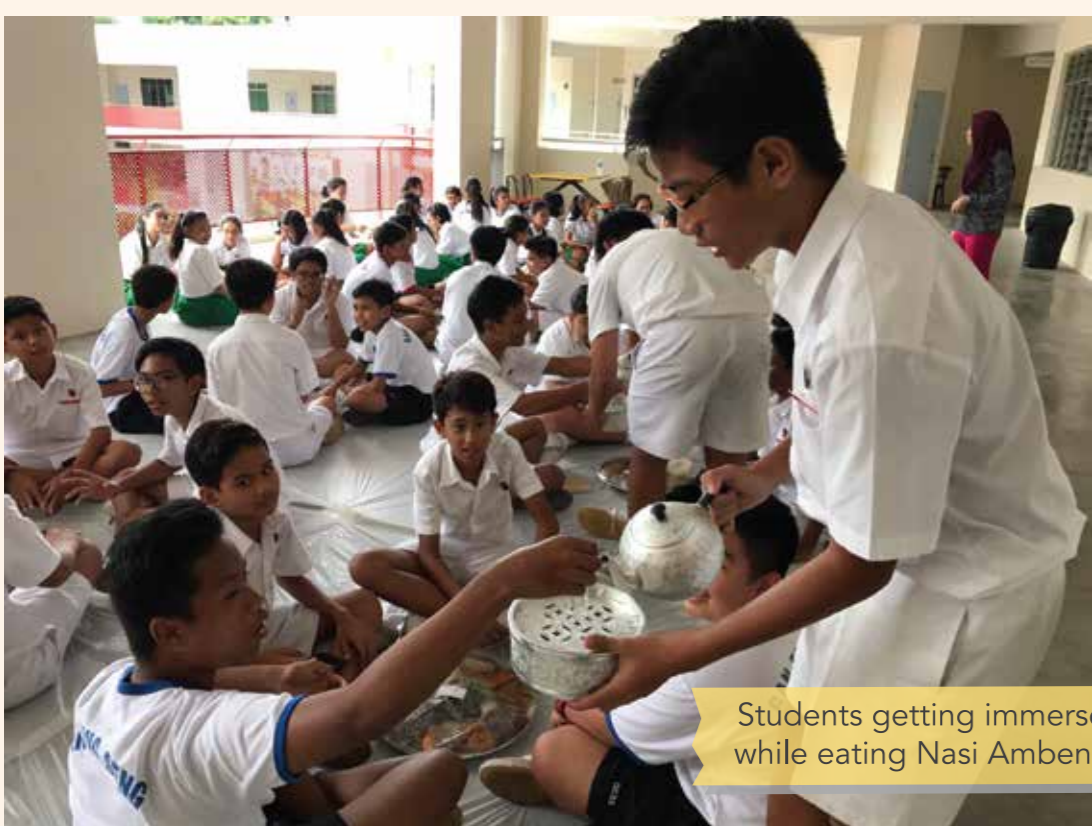
Students getting immersed in the Malay Culture while eating Nasi Ambeng during MTL Fortnight