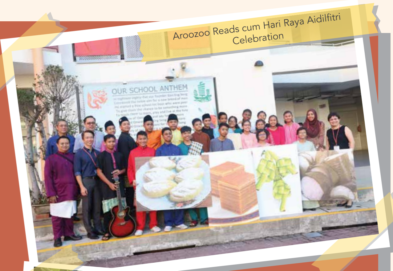
Aroozoo Reads cum Hari Raya Aidilfitri Celebration

Di akhir setiap tahun, Unit Bahasa Melayu di GESS menganjurkan program lawatan sambil belajar bagi para pelajar menengah bawah. Pakej pembelajaran bagi program tersebut dihasilkan khas oleh guru-guru Bahasa Melayu di GESS. Program tersebut bukan sahaja mewujudkan persekitaran yang autentik dan menarik untuk menggalakkan penggunaan Bahasa Melayu tetapi juga memupuk sikap bekerjasama dalam kalangan pelajar.