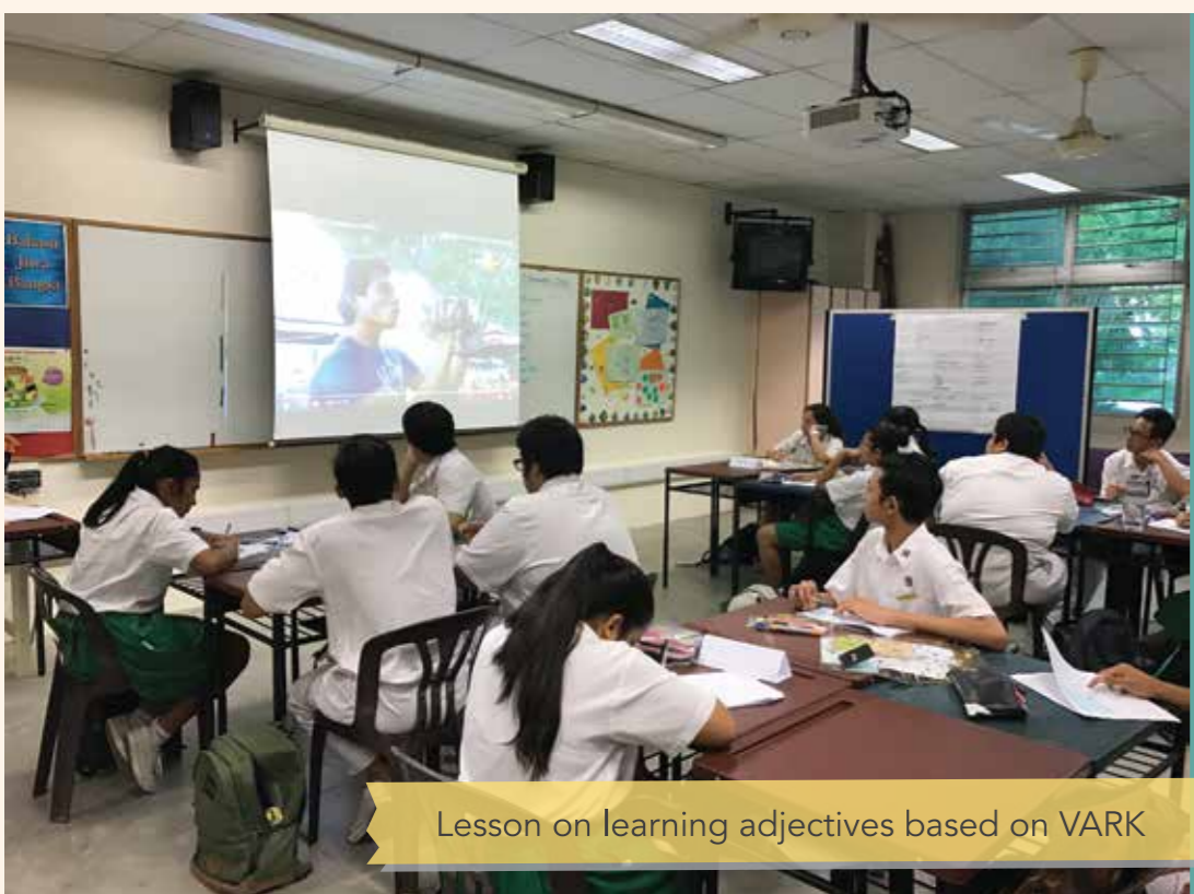
Lesson on learning adjectives based on VARK