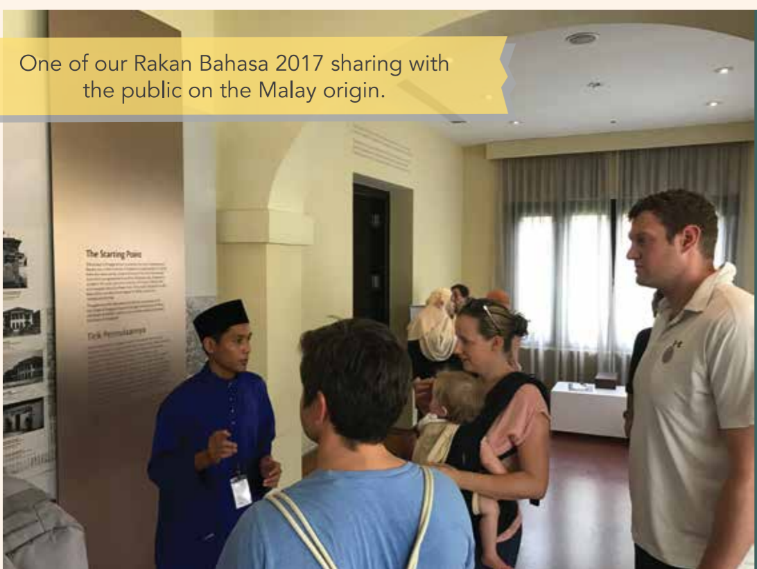
One of our Rakan Bahasa 2017 sharing with the public on the Malay origin.