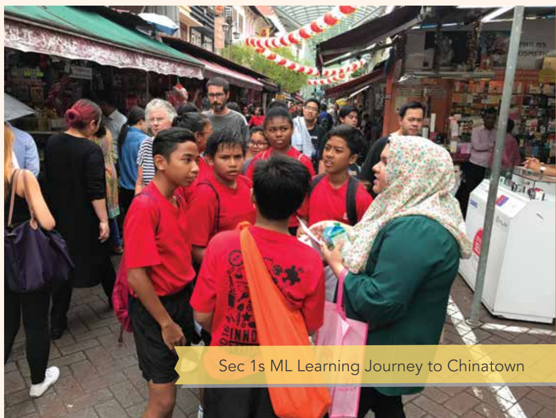
Sec 1s ML Learning Journey to Chinatown